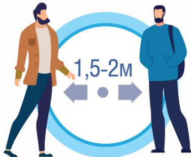
СОБЛЮДАЙТЕ РАССТОЯНИЕ И ЭТИКЕТ