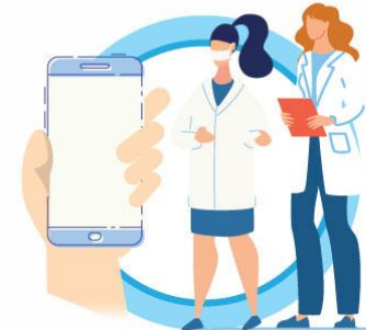
В СЛУЧАЕ ЗАБОЛЕВАНИЯ ОБРАЩАЙТЕСЬ К ВРАЧУ